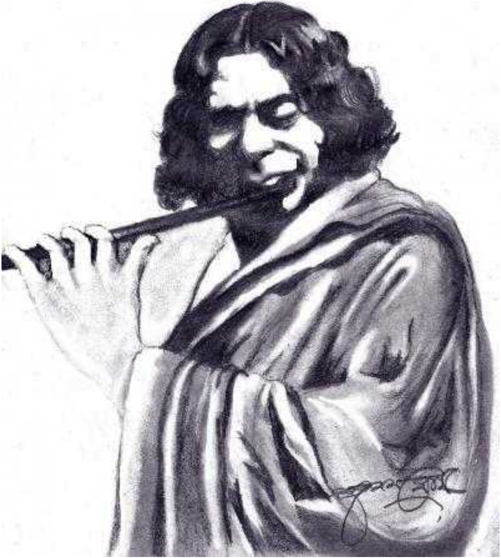
বংশীবাদনরত নজরুল, ১৯২৮ চট্টগ্রাম