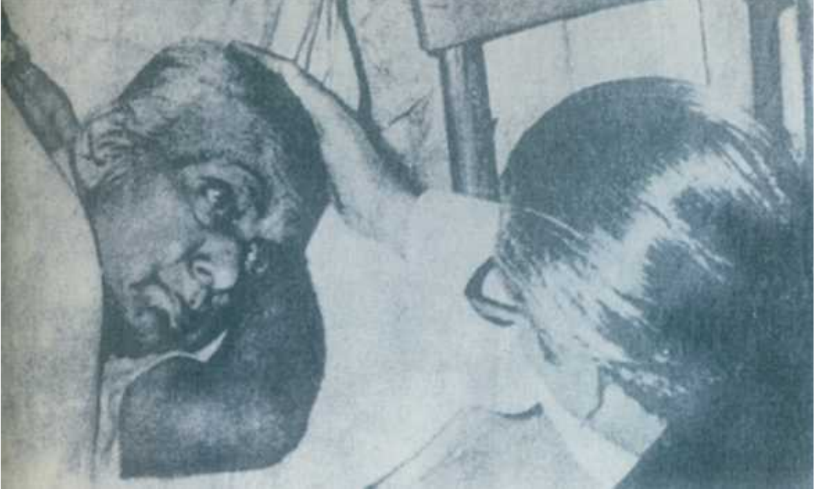
কবির মাথায় হাত বুলিয়ে দিচ্ছেন বঙ্গবন্ধু শেখ মুজিবুর রহমান