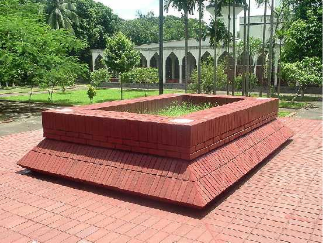
ঢাকা বিশ্ববিদ্যালয়ের পাশে চিরনিদ্রায় শায়িত আছেন কবি